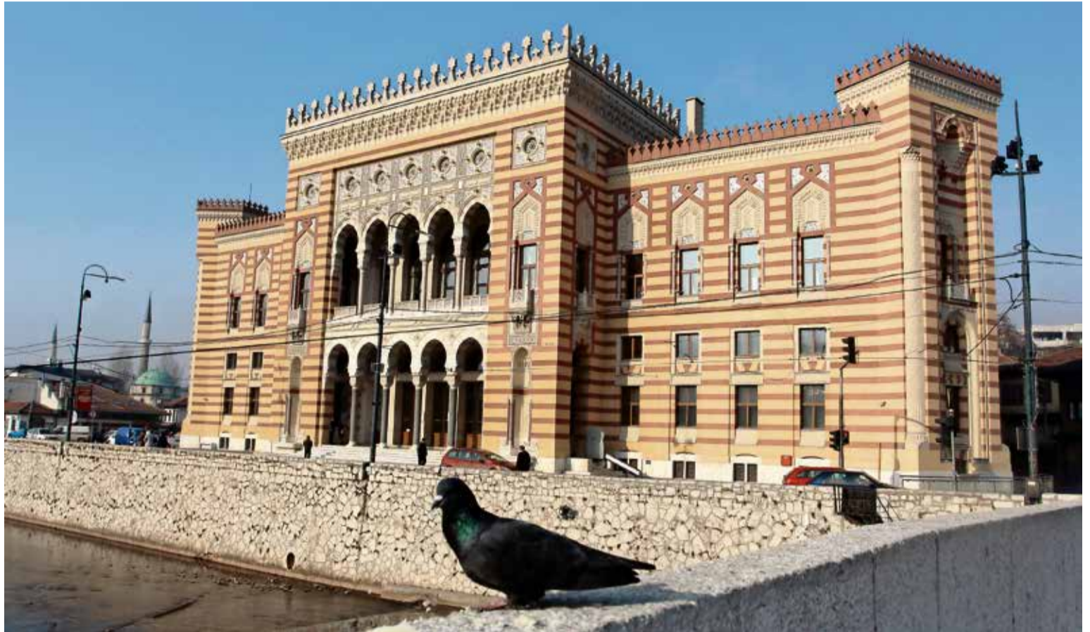
Vijećnica je spaljena 1992, a obnovljena 2014. godine

Kada je riječ o njegovom resoru, ministar ne krije kako ne može biti zadovoljan radom Elektroprivrede BiH, gdje bi se određenim mjerama moglo unaprijediti poslovanje. / STR. 6. i 7.